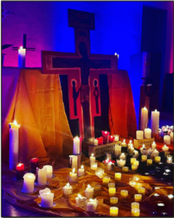
Taizé in der Emmauskirche