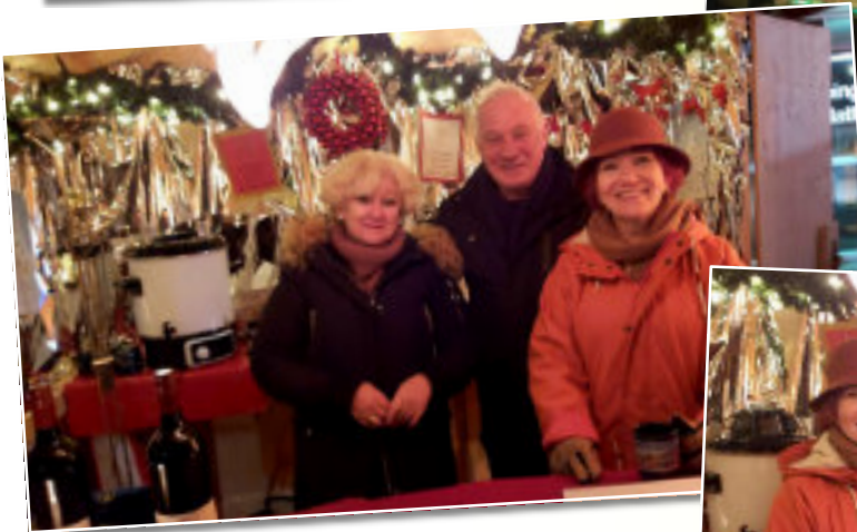
Christkindlmarkt in Hallbergmoos am 26. und 27.11.2022