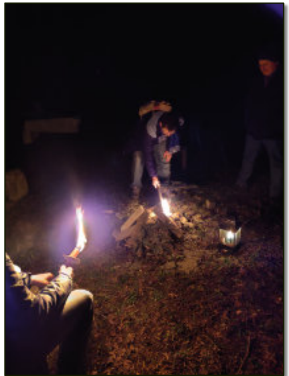
Osterfeuer bei der Auferstehungskirche