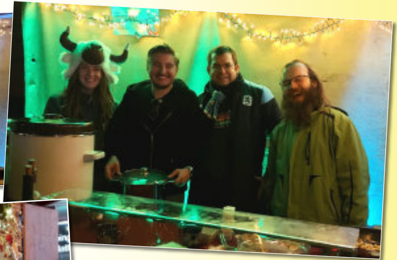
Christkindlmarkt in Neufahrn am 27.11.2022